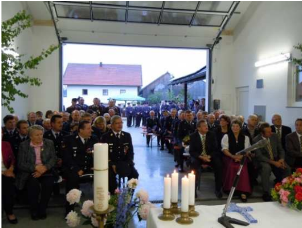
Gottesdienst bei der Gerätehausweihe