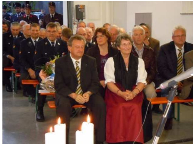
Bei den Ansprachen