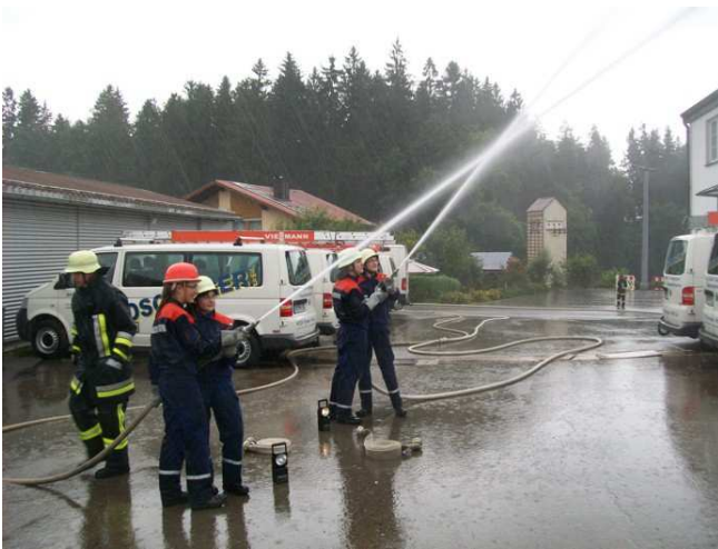
Die Jugendfeuerwehr bei der Gemeinschaftsübung