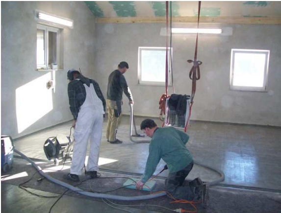
Einbau des Industrieboden