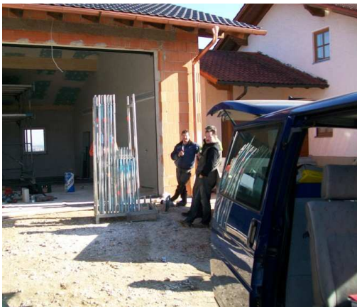
Pause auf der Baustelle