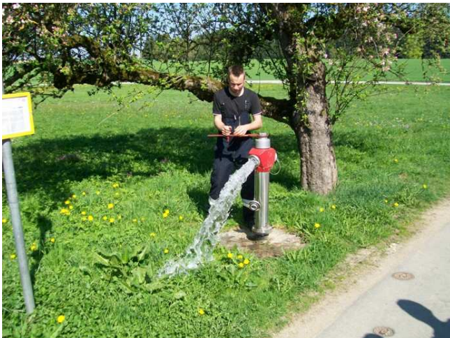
Überprüfung der Löschwasserentnahmestellen