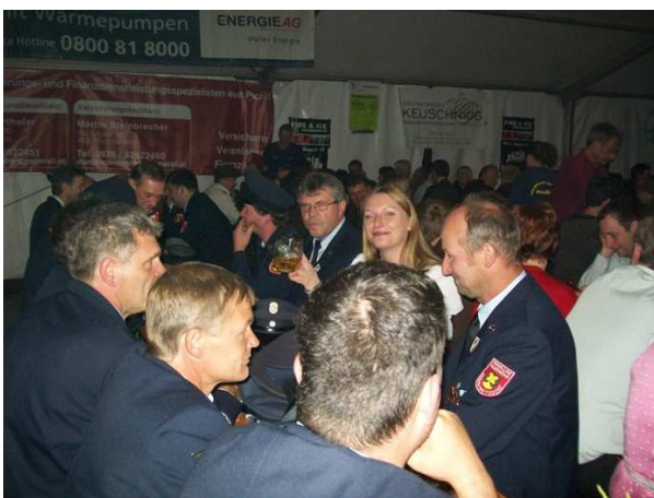
Im Festzelt bei der Fahrzeugweihe in Sulzbach