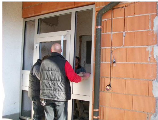
Einsetzen des Türelement