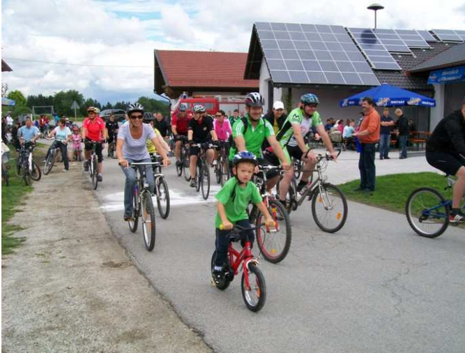
Volksradfahren beim Dorffest