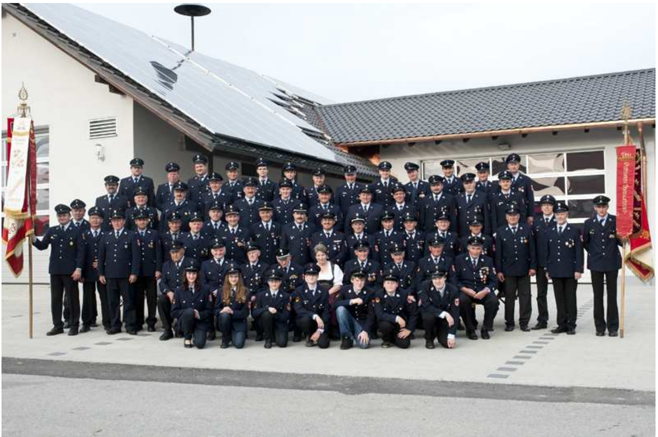
Das Mannschaftsfoto 2011