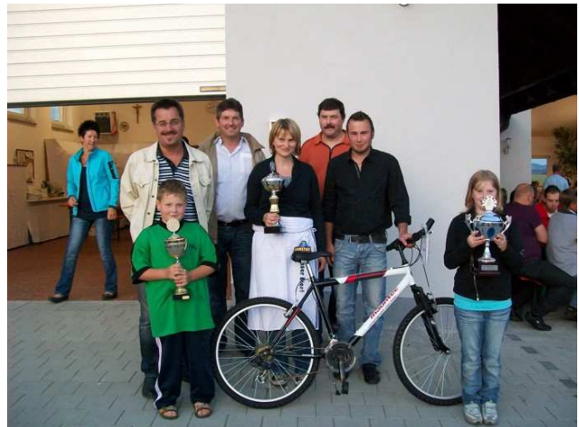
Preisverleihung beim Radfahren